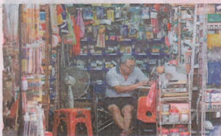
קשיש עובד בחנות כלי בית, בסניפפור

כשרוב העצמאים חיים במלחמת קיום יומיומית, הרבה האחרון שהם חושבים עליו זה הפנסיה". השנה נכנס לתוקף חוק פנסיה חובה לעצמאים. "למי שמתחיל עכשיו את דרך זה החוב. זה יקבע כלל שחייב את העצמאים להביא בחשבון את עניין הפנסיה. הם לא יוכלו להימנע מעניין זה כמו שאני עשיתי. אבל לאדם בגילי אני לא יודע כמה ההפרשה תהיה רלוונטית".