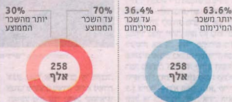
מקור: החוסר לביטוח לאומי, תוני 2014

ההפסיק לעבוד באופן יזום, אלא רק כשאילץ לעשות זאת, ואני מקווה שזה לא יקרה. כל עוד כר חי במנות, אמשיך לעבוד – גם כי אני נהנה, וגם כי אני לא יכול להסתמך על הפנסיה". למה בעצם לא תהפוך את הפנסיה ל"חשבתי על זה תמיד. כל אדם עם שכל והיגיון חושב על העתיד, אבל זה לא הניע אותי לצעד אופי"